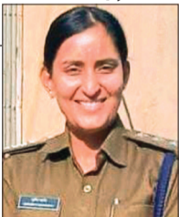
हरिभूमि न्यूज ► बागली