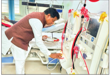
हरिभूमि न्यूज ► आष्टा